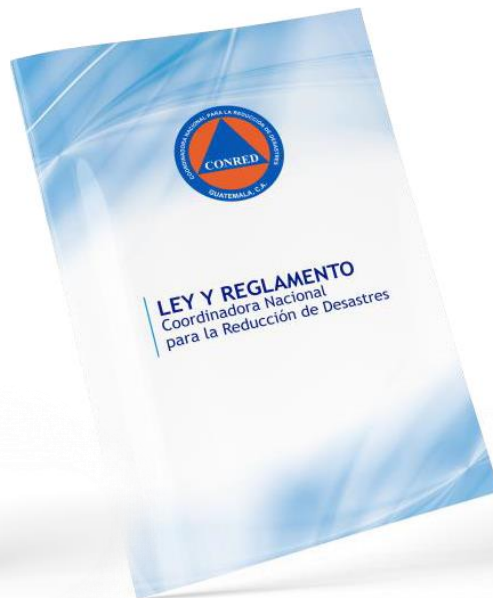
Ley de la Coordinadora Nacional para la Reducción de Desastres de Origen Natural o Provocado (Decreto 109-96)