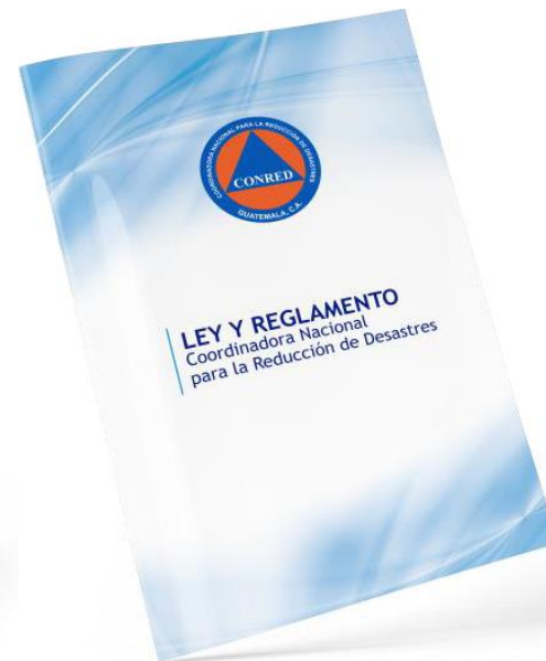
Reglamento de la Ley de Coordinadora Nacional para la Reducción de Desastres de Origen Natural o Provocado (Decreto 109-96)