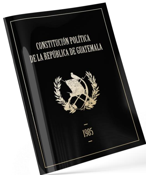
Constitución Política de la República de Guatemala